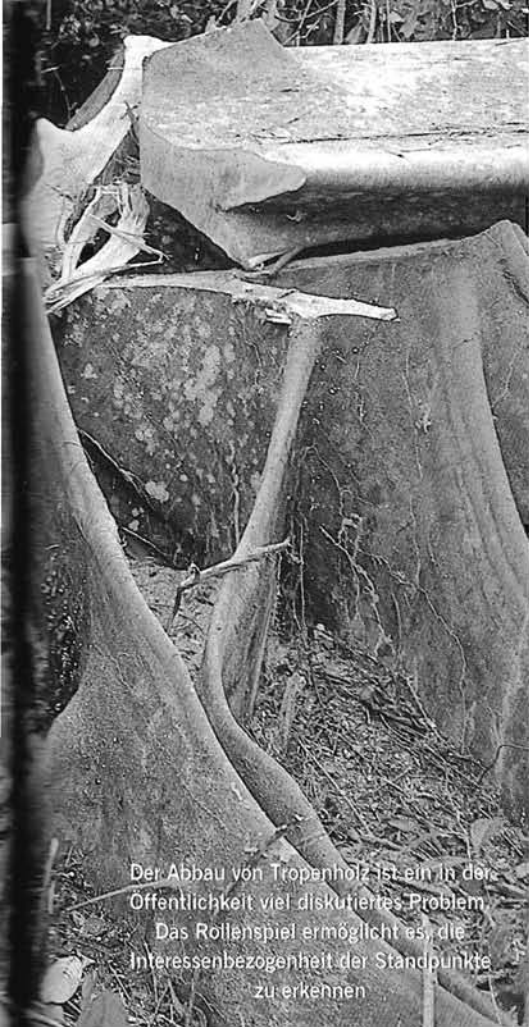
Der Abbau von Tropenholz ist ein in der Öffentlichkeit viel diskutiertes Problem. Das Rollenspiel ermöglicht es, die Interessenbezogenheit der Standpunkte zu erkennen.